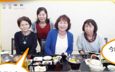
今回は2名欠席ですが、楽しい親睦会!