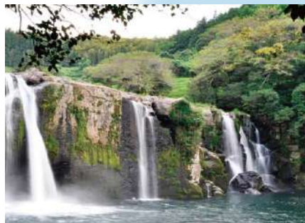
産さん滝・横滝 水量の多い時は横幅いっぱい に水が落ち、壮観な眺めです