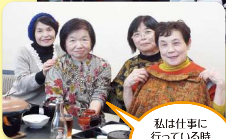
私は仕事に行っている時以上に忙しい毎日です