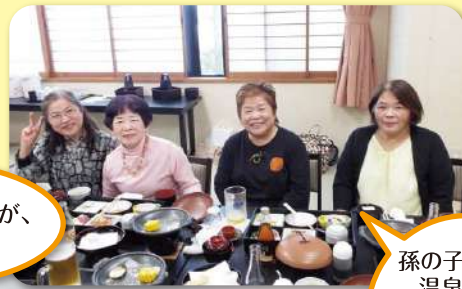
孫の子守りや温泉での歩行浴などで毎日楽しく過ごしています