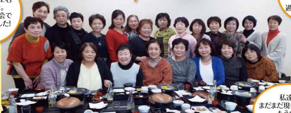
私達はまだまだ現役組です。もう少し頑張りますよ!