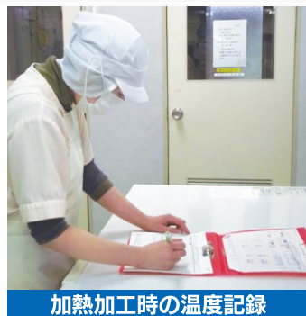
加熱加工時の温度記録